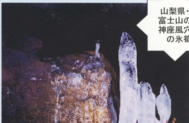
山梨県・ 富士山の 神座風穴 の水筈